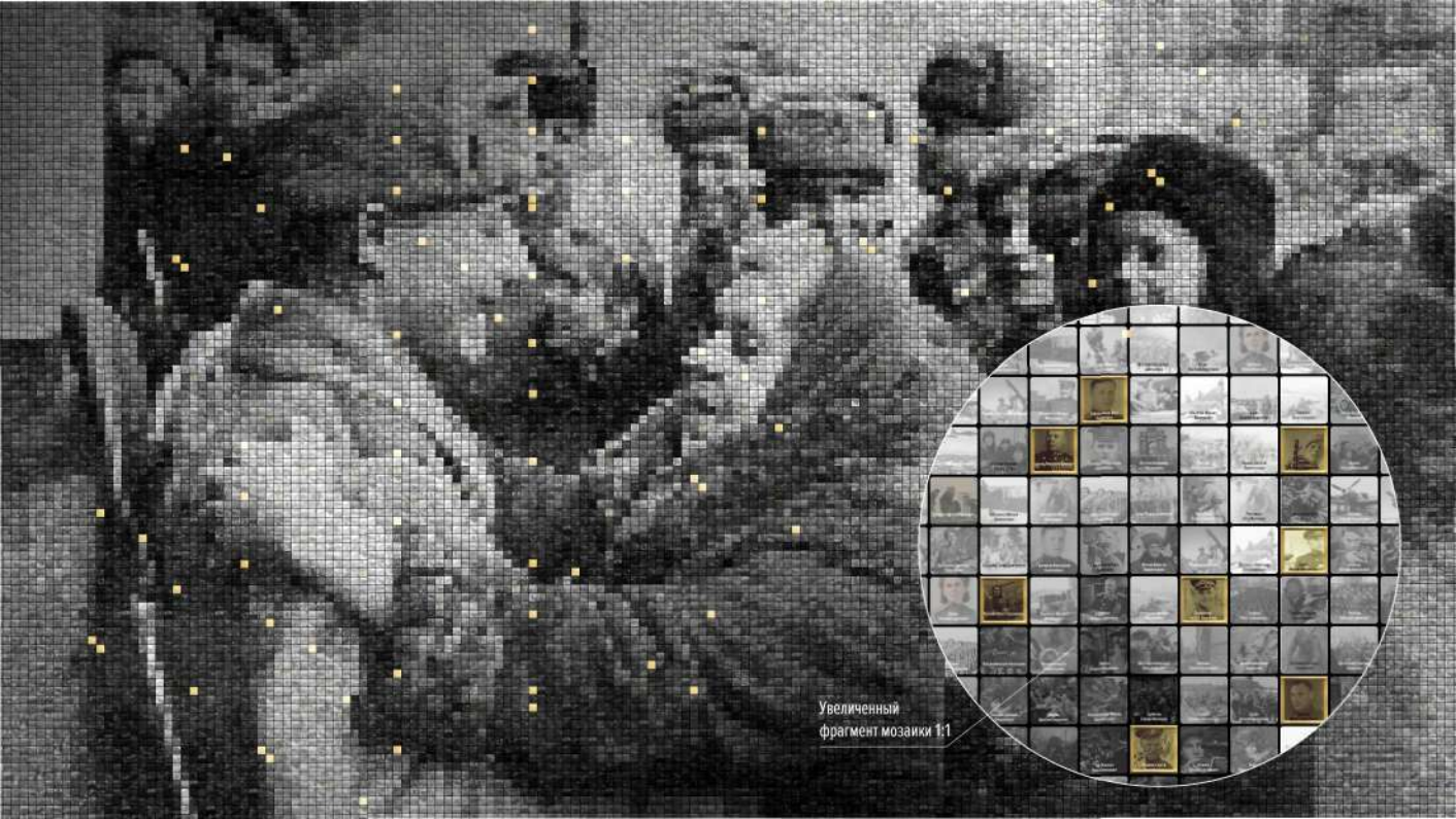
Увеличенный фрагмент мозаики 1:1